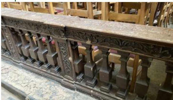
Un banc de communion de la chapelle Saint-Lambert à Verviers, encore couvert de boue