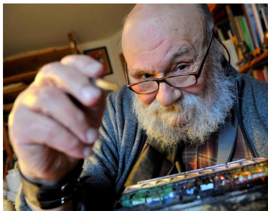
Le regretté René Hausman

Pour ceux qui seraient intéressés – et il y a des petites merveilles à acquérir (dont un bronze de Frank Pé.. entre autres trésors) – voici la liste (non exhaustive) des participants.. dans laquelle on retrouve les noms de tout grands de chez nous : Batem - Berlion - Bourgne Capezzone – Carin - Casten - Civiello - Comès Courtois- Craenhals – Dany - De Ville - Deliège Delvaux - Di Sano – Dress - Follet - Frank Pé- Géri – Gilson - Marc Hardy – René Hausman -Henriet – Hub- Jaap de Boer - Jacot - Jannin – Jarbinet - Jérémy – Kox- Krings – Lacroix- Line - Lorenzo Malfin - Marc-Renier - Marlier Mazel – Meynet - Michetz - Mika – Mittéi - Munuera - Osi - Papazoglakis – Paulis- Peral - Pirotton Poncelet Rouchairoles- Saive - Seron – Servais - Smudja Speltens - Studios Peyo - Venanzi – Vink- Walthéry – Wurm