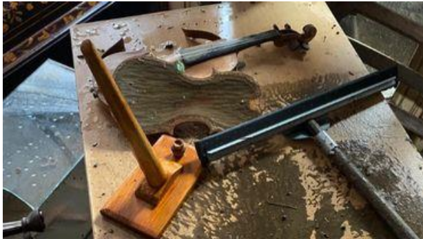
Le premier violon d'Henri Vieuxtemps saccagé par les inondations au musée d'Archéologie et de Folklore de Verviers

Parmi les dégâts figure symboliquement le premier violon d'Henri Vieuxtemps qui venait d'être restauré et le Bethléem Verviétois, un théâtre de marionnettes du XIXe siècle qui sort uniquement à Noël.