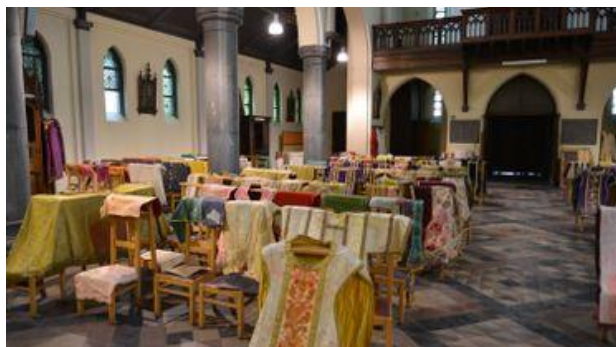
Vêtements liturgiques provenant de la chapelle Saint-Lambert mis à sécher dans l'église Saint-Jean-Baptiste, une des rares églises épargnées à Verviers.

Pour les objets en marqueterie par exemple, il faut éviter un séchage trop rapide : si la colle sèche d'un coup, tout risque de se décoller. Pour les textiles, comme les vêtements liturgiques, il faut éviter un séchage à plat, qui risque d'entraîner des déformations.