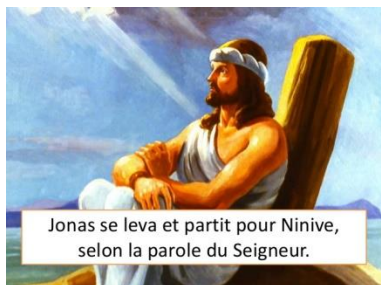
Jonas se leva et partit pour Ninive, selon la parole du Seigneur.

La parole du Seigneur fut adressée de nouveau à Jonas : « Lève-toi, va à Ninive, la grande ville païenne, proclame le message que je te donne sur elle. »