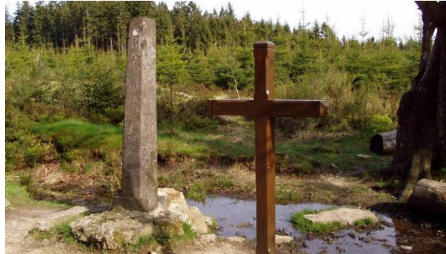
La Croix des Fiancés dans les Fagnes.