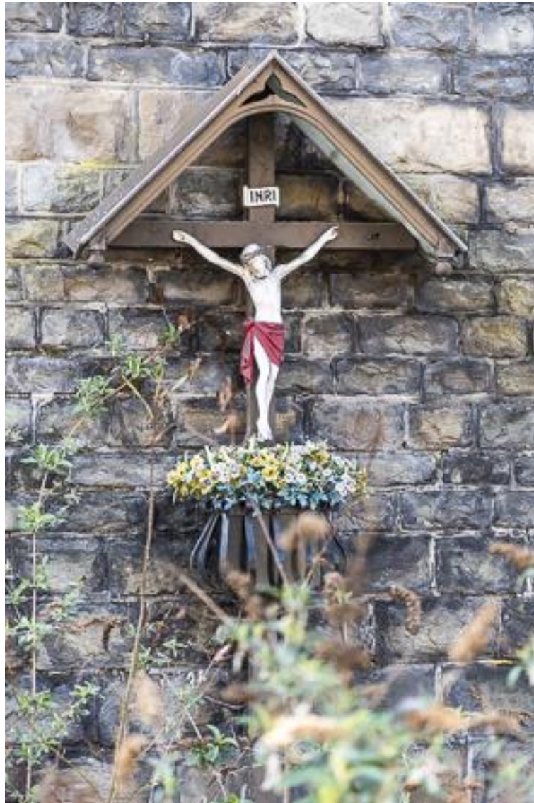
Verviers Av. Mullendorff.