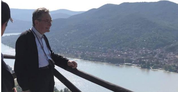
Mgr Aloys Jousten lors du 52e Congrès Eucharistique à Budapest (5-12 septembre 2021).

Un évêque soucieux des grands enjeux sociaux de notre temps.