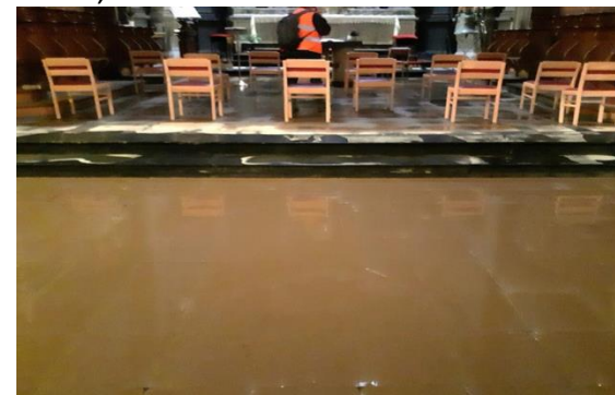
L'église Saint-Remacle quand l'eau était déjà bien redescendue (4)

Une récolte de matériel et de manuels scolaires s'organise aussi par son association qui œuvre au Congo, les Amis de Cibombo de Dison, tous les dimanches aux célébrations.